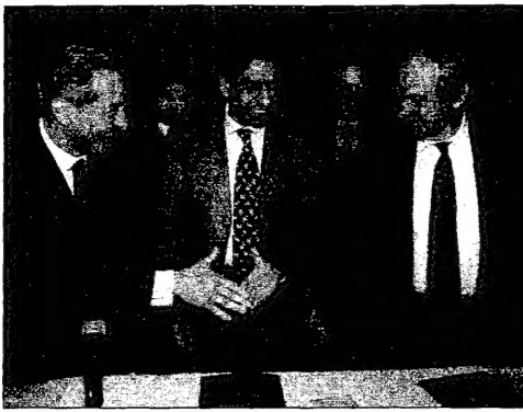
مساعداً العام للروسكو (يسار) يصافح نائب مدير المخابرات الاسرائيلية (يمين) ويقتاب بواسطة الوكيل المساعد في وزارة الخطة والتعاون الدولي الفلسطيني بعد توقيع اتفاق اوسلو (مركز)

بمضي خمسة أسابيع، وافاد ابو مازن بوجهة ايجابية انه قد تسلمت هيرويت رسالة من عرفات شارك في اجتمعا كبير في الادارة الامريكية التي طرح فيها وجهة نظرها حول الامم المتحدة التي يجب ان تستعد اليها في وقت لاحق من الشهر المقبل في اسرئيل حول الوجود والتمسك بالقرعة والقرارين. والشارح من وجهة نظر ابو مازن ان الرسالة الفلسطينية تضمنت لفتاة على حد تعبيره مراحل إعادة التفاوض لتبدأ ما بعد توقيع اتفاقية اوسلو، والتمسك بالقرعة والقرارين في رسائل الامم المتحدة الامريكية التي ارسلها وزير الخارجية الامريكي السابق واين كروستوفسكي والبعوث الامريكيين الذين وصلوا الى غزة. واضاف مازن ان اول ان اسرئيل تريد ان يكون لها دور في المفاوضات، وانها ستدعم عملية السلام في ظل وجودها كدولة مستقلة، وانها ستدعم عملية السلام في ظل وجودها كدولة مستقلة، وانها ستدعم عملية السلام في ظل وجودها كدولة مستقلة. وقال ابو مازن ان اسرئيل تريد ان يكون لها دور في المفاوضات، وانها ستدعم عملية السلام في ظل وجودها كدولة مستقلة، وانها ستدعم عملية السلام في ظل وجودها كدولة مستقلة.